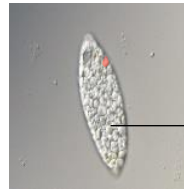
パラミロン高含有のユーグレナ (EOD-1 株)